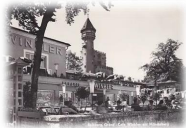
Grand Café Winkler am Mönchsberg