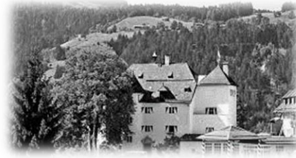
Schlosshotel Lehenberg / Kitzbühel