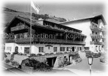
Hotel Panther in Saalbach Hinterglemm