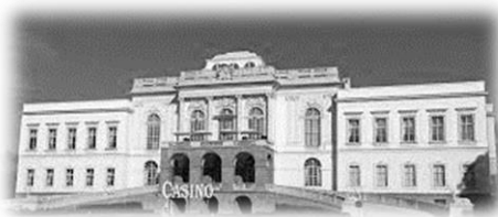
Casino – Restaurant im Schloss Klessheim